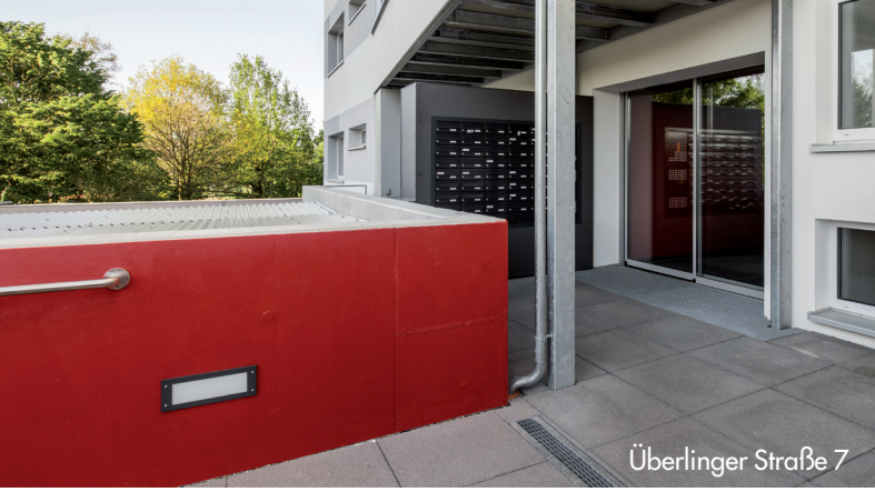
Überlinger Straße 7