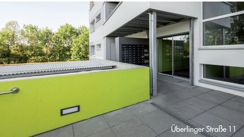
Überlinger Straße 11