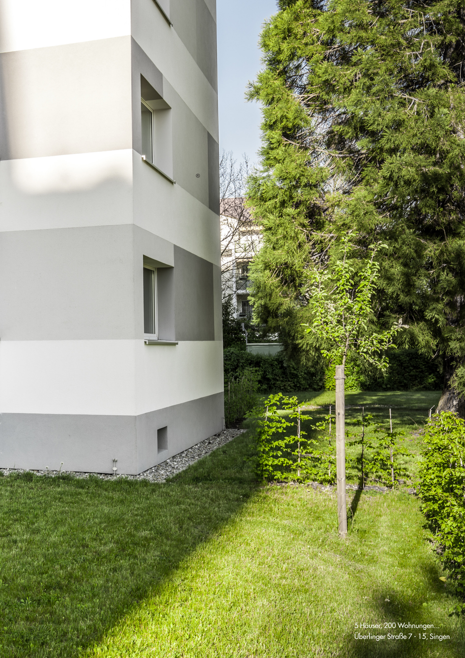
5 Häuser, 200 Wohnungen... Überlinger Straße 7 - 15, Singen