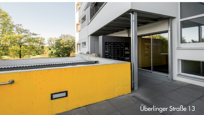
Überlinger Straße 13