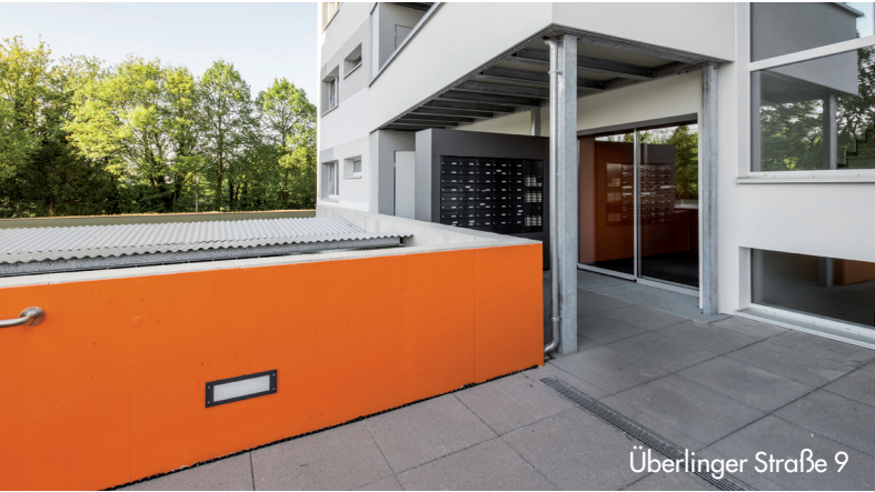
Überlinger Straße 9