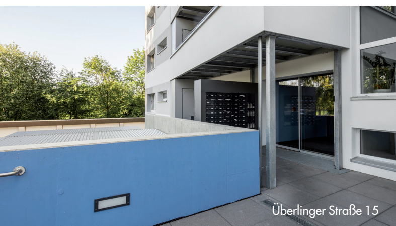
Überlinger Straße 15