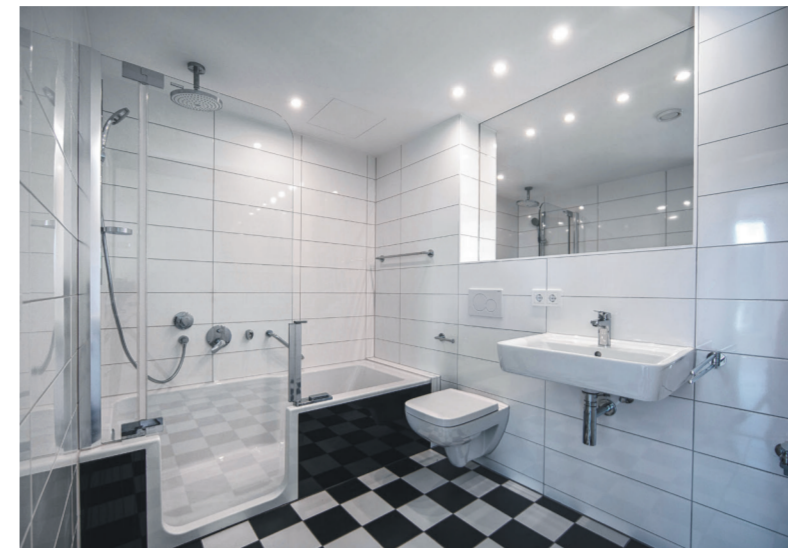
Die Bäder mit Dusch-/Badewanne und bodennahem Türeinstieg.