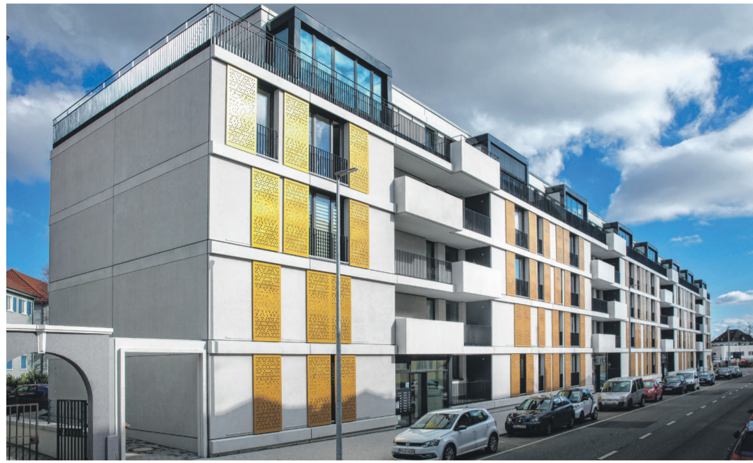
Die Straßenseite der Praxedis-Gärten besticht durch klare Architektur mit großen Fenstern und goldenen Schiebeläden.