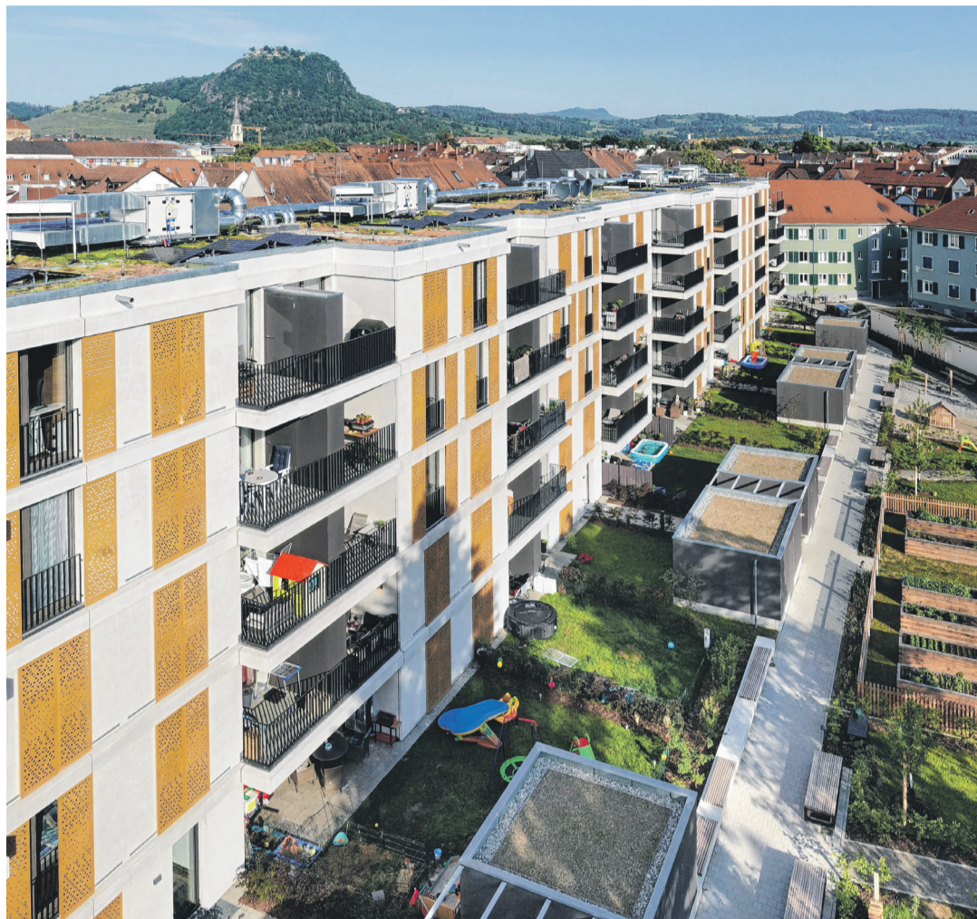
Bei den Praxedis-Gärten ist der Name Programm – stadtnah mit eigenem Garten im Grünen Mietwohnen.

Und so schreiben die Praxedis-Gärten ihr eigenes Kapitel in der vielfältigen Geschichte der Romeiasstraße. Und damit ist es nun auch Zeit für einen solchen Text.