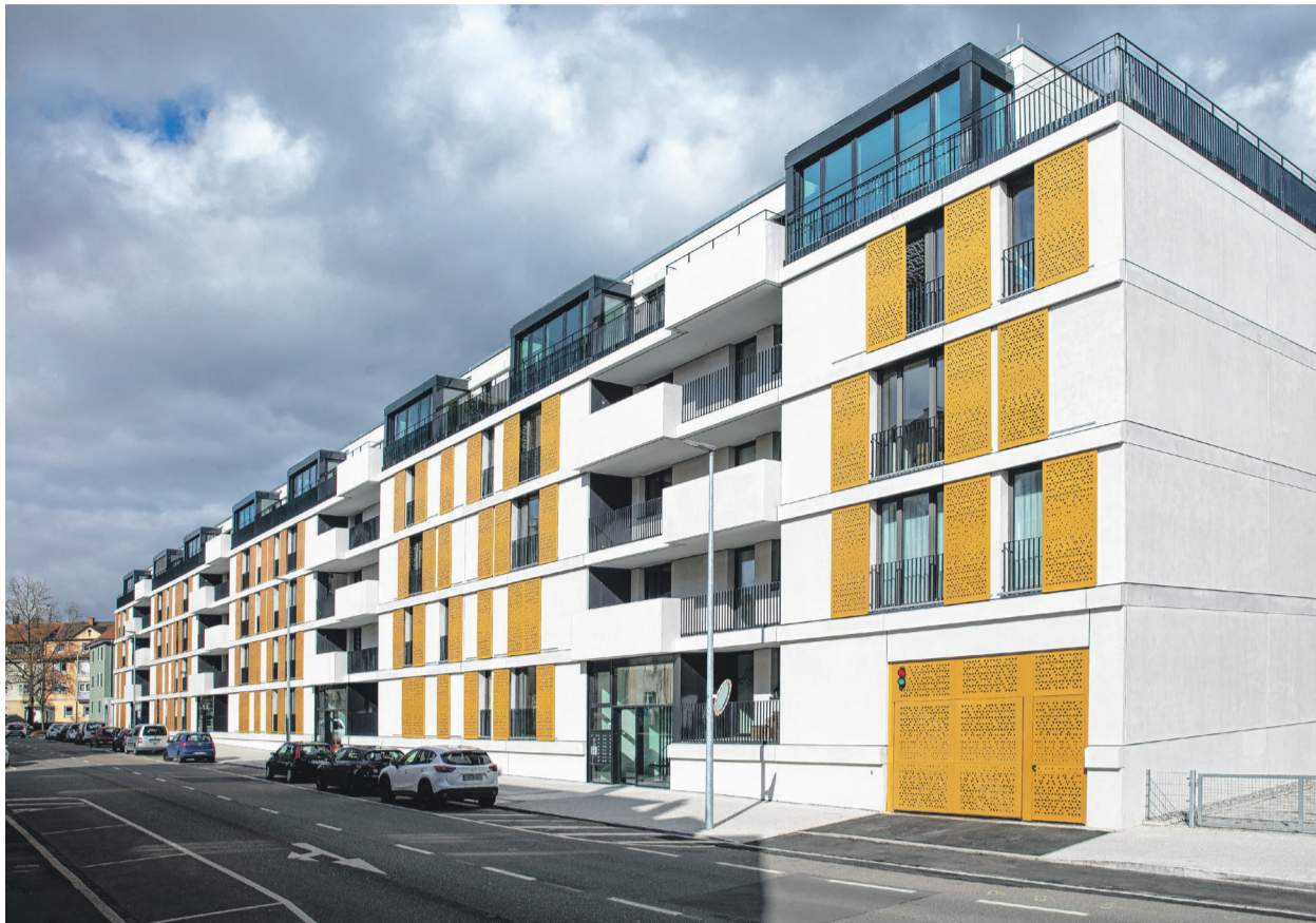
(Linkes Bild): Der Neubau Praxedis-Gärten der Baugenossenschaft HEGAU an der Romeiasstraße. (rechts, oben) Die alte Wohnbebauung von 1936 und (rechts, unten) das Baggerballett zum Abbruchbeginn und Abschluss des Kunstfestivals ARTE ROMEIAS.