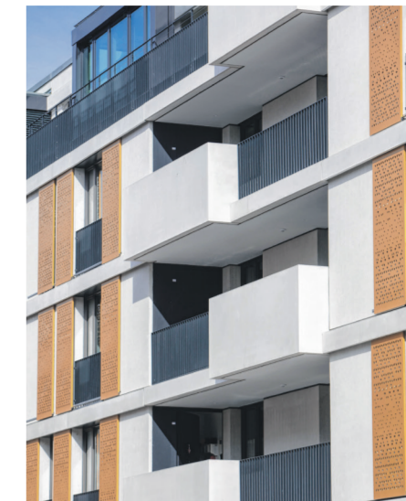
Architekturqualität durch Fassadengestaltung.