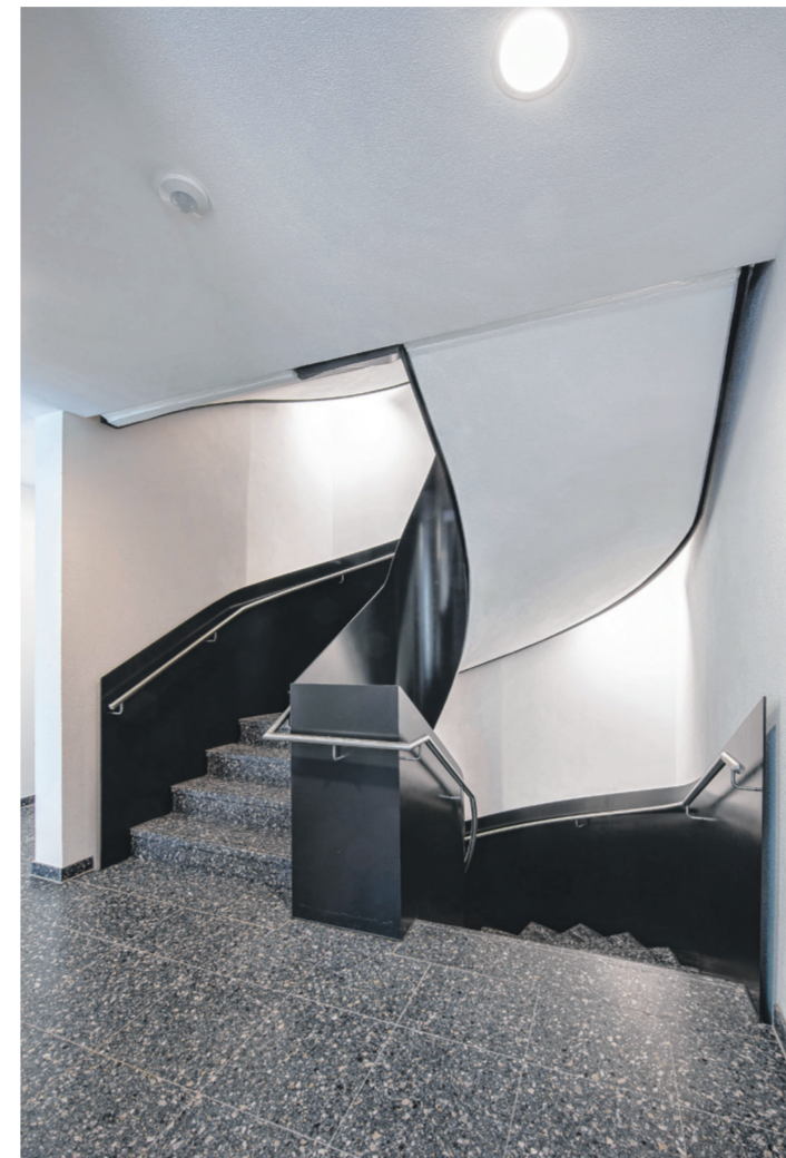
Die Treppenhäuser zeichnen sich durch eine ungewöhnliche Dynamik mit Anmutung an die 20er Jahre aus.

halb der Formgebung aus, sie etablieren sich als helle Lichtschächte, welche die Bewohner und Bewohnerinnen willkommen heißen. Wenn man so will tragen die Praxedis-Gärten den Geist des Kunst-Festivals ARTE ROMEAIS bis heute in sich. Denn eine solche gestalterische Qualität der Wohnanlage, eine derartige kreative Offenheit der Architektur ermöglicht ein anderes Wohn- und damit auch Lebensgefühl. Modern. Aber doch auch nahe am Menschen. Insgesamt 73 Mietwohnungen sind im 100 Meter langen Neubau entstanden. Dabei ist es egal wie viele Zimmer die Wohnungen haben – sie sind allesamt „durchgesteckt“. Das bedeutet, dass jede Wohnung sowohl mit Fenstern in den ruhigen Garten im Innenhof in Richtung Nordosten, aber auch mit Fenstern zur besonnten Straßenseite in Richtung Südwesten aufwarten kann und ihren Bewohnern somit eine gesunde Brise Licht und Offenheit bietet. In Kombination mit den großen, einladenden Fenstern, Frischluft garantierenden Balkonen und Terrassen und dem einladenden Echtholzparkett wirkt sich die Architekturqualität des Neubaus direkt auf die Wohnqualität aus. Denn als Mieter oder Mieterin hat man in den Praxedis-Gärten eben nicht das Gefühl in ein unpersönliches Wohnungskonglomerat gepresst zu werden. Gerade in Singen, wo besondere Architektur nach wie vor Mangelware ist, erscheinen die Praxedis-Gärten als Hingucker, der zur echten Heimat werden kann.