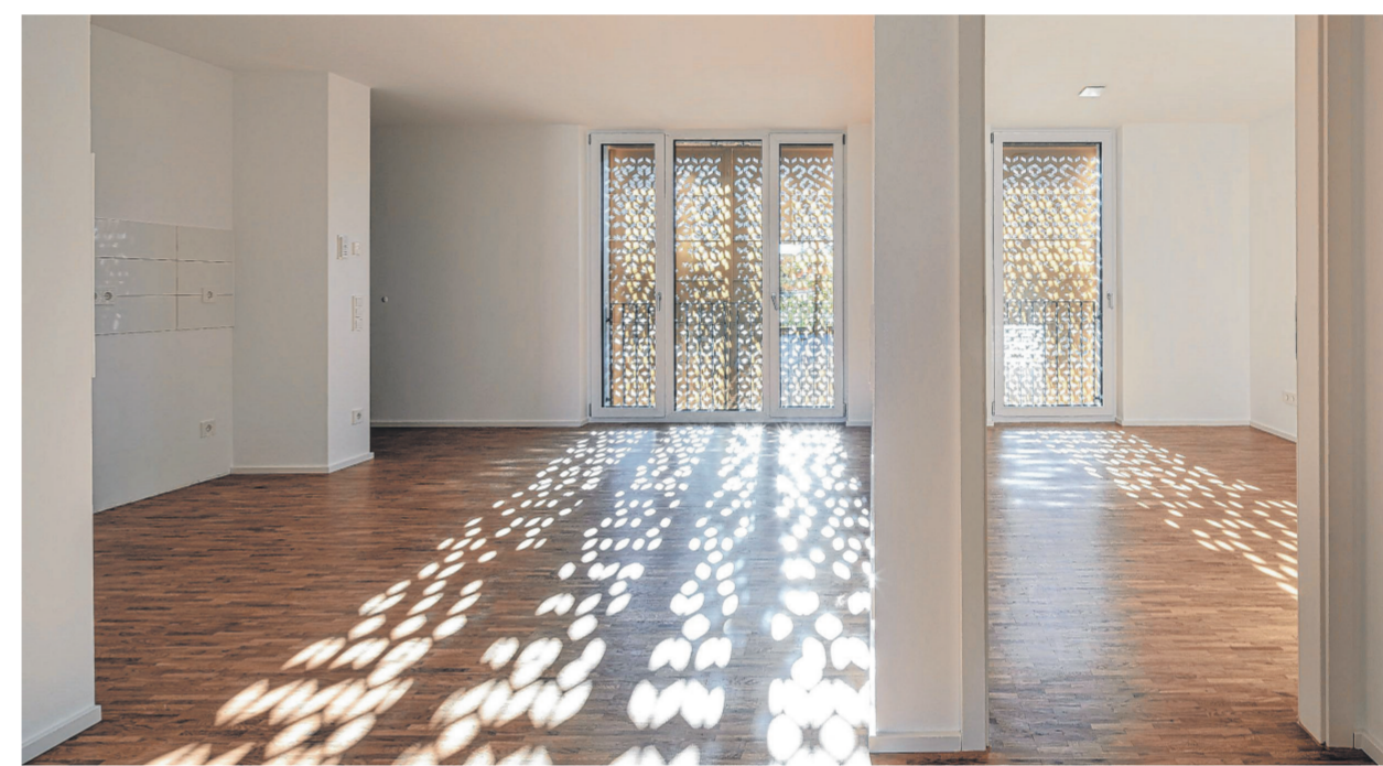
Schiebeläden zeichnen mit einem Muster aus Licht eine ganz besondere Atmosphäre in den Raum.

Baugenossenschaft HEGAU eG mehr als gewohnt!