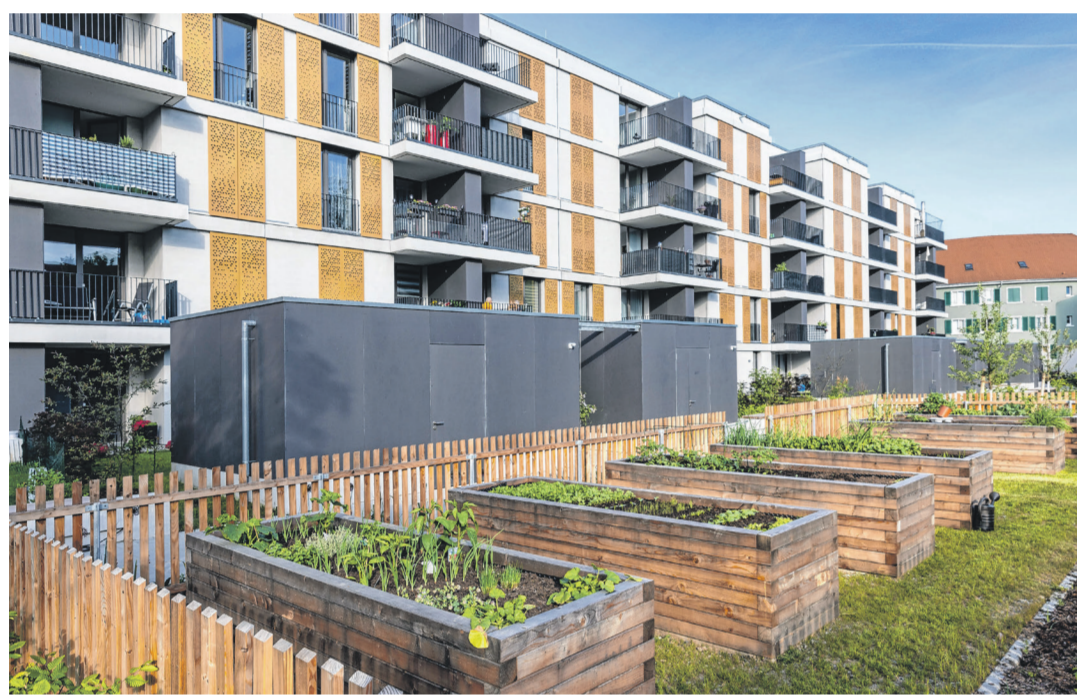
Alle zukünftigen Bewohner und Bewohnerinnen haben Zugang zur grünen Gartenanlage im Innenhof.