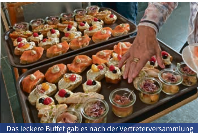
Das leckere Buffet gab es nach der Vertreterversammlung