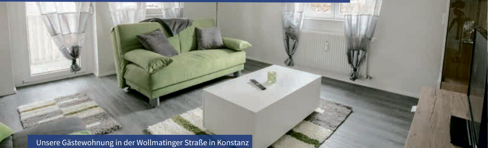
Unsere Gästewohnung in der Wollmatinger Straße in Konstanz

Nach zwei Jahren Pandemie sind wieder schöne Städtereisen innerhalb Deutschlands und in die Schweiz möglich. Der Gäworing hat seine Arbeit wieder aufgenommen.