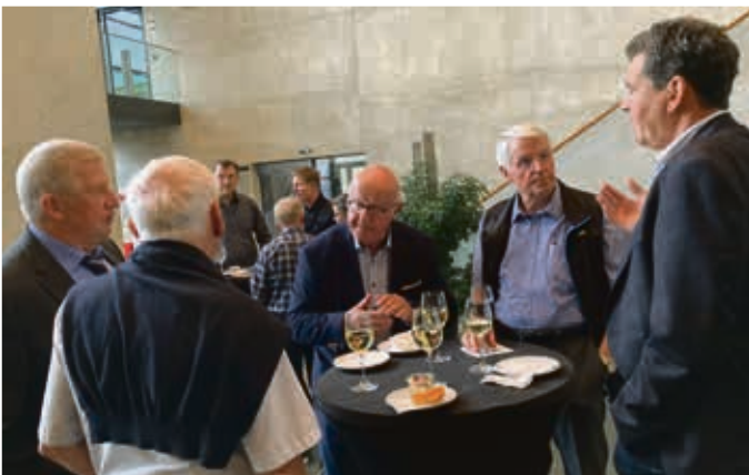
Nach der Vertreterversammlung traf man sich noch zum lockeren Gespräch