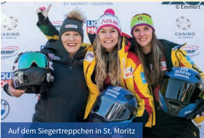
Auf dem Siegereppchen in St. Moritz

Die Frauenbobs der deutschen Nationalmannschaft sind in der vergangenen Wintersaison 2022/23 mit dem Bauklötzchenlogo angetreten.